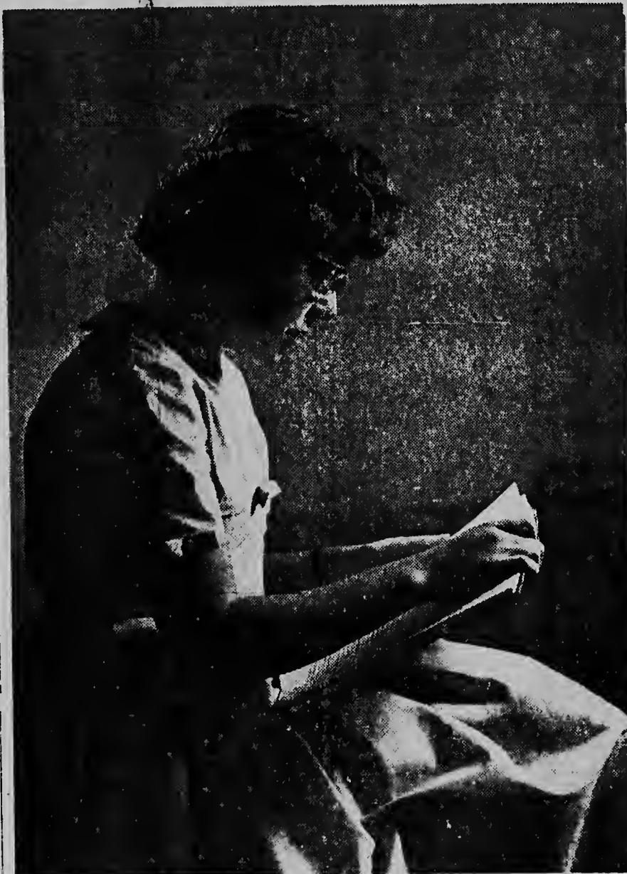
Un reciente portret di S. A. R. Prinses Maria Christina (Marijke) kende awe ta cumpli 13 anja.